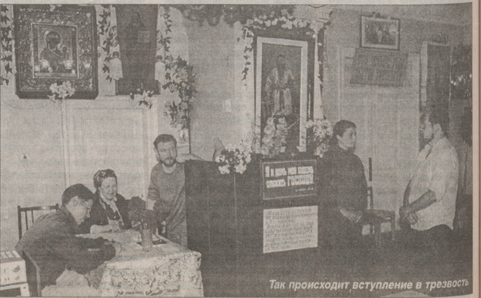
Так происходит вступление в трезвость

нает день своего отрезвления. Моя проблема полтора года тяну-