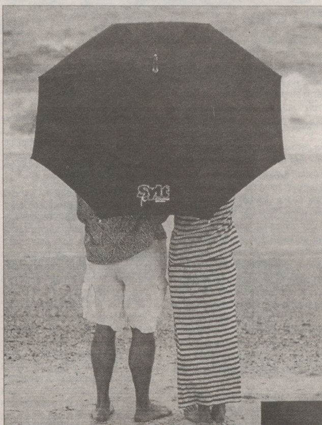
Между июнем и сентябрем, когда в школах каникулы, а большие предприятия закрыты на общий отпуск, вся Италия лежит на пляже. Для ночлега часто используются автомобили-дачи, кроме того, жилье можно и снять. Поездки за границу здесь только начинают входить в моду. Летом итальянские города "вымирают", воздух в них становится чище, а жизнь для немногих оставшихся горожан и иностранных туристов - спокойнее.

июля и двадцатыми числами августа. Тот, кто работает в больших городах, таких, как Салоники, Патры или Афины, отправляется на это время к родственникам в деревню. Назад, к корням! Однако в последнее время входят в моду и туристические поездки, на протяжении которых греки хотят жить в дорогих отелях, есть в хороших ресторанах и вести бурную ночную жизнь - иначе отпуск не отпуск!